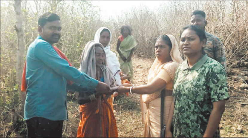
मृतक के परिजनों को सहायता राशि सौंपते वन अमला।